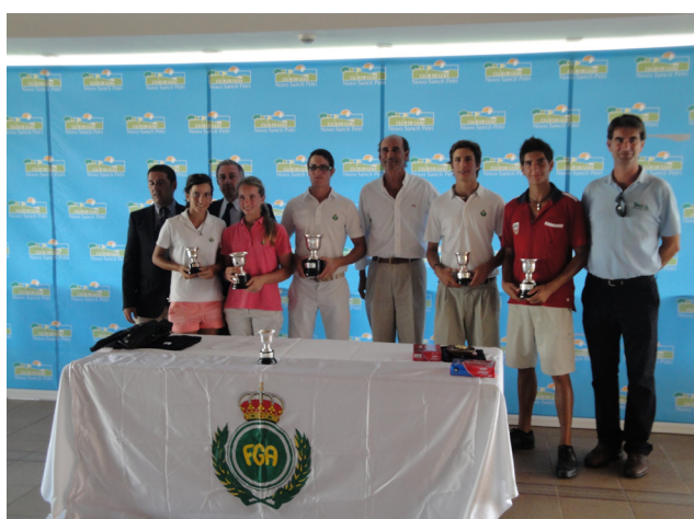
Campeones-Campeonato Junior, Boys y Girls de Andalucía

La Real Federación Andaluza subvencionó a los ocho primeros clasificados.