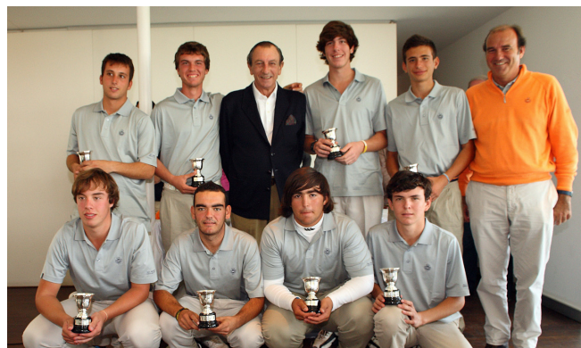
Campeones-Equipo Junior Masculino